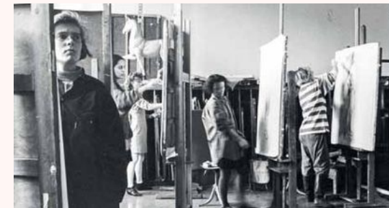
200 år med tegneskole blir feiret gjennom publikasjoner og utstillinger denne høsten. Her representert ved noen av skolens tidligere elever.