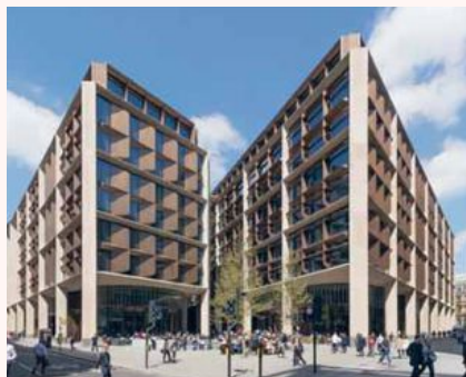
Er Bloomborgs nye hovedkvarter i London «klumpete» og «miljøvennlig» eller et bygg som sprengt taket for kontordesign og byplanlegging?

Også The Guardians arkitekturkritiker, Oliver Wainwright, har vært skeptisk til Bloomborgbyggets miljøhensyn, med tanke på bruken av 600 tonn japansk bronse og et «steinbrudd» av grannitt fra India i utformingen. I samme anmeldelse kaller han dessuten Norman Fosters design for både klumpete og prosaisk.